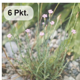
Sprossende Felsennelke 2