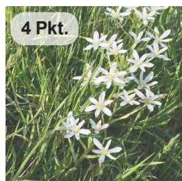
Doldiger Milchstern 1