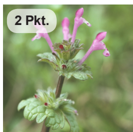
Stängelumfas. Taubnessel 2