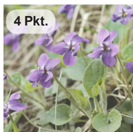
Wohlriechendes Veilchen 2