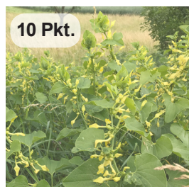
Echte Osterluzei 1