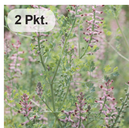
Gew. Erdrauch 2