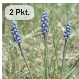
Gem. Traubenhyazinthe 3