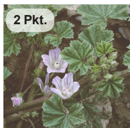
Kleine Malve 2