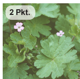
Rundbl. Storchenschnabel 2