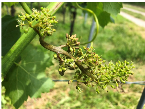
Traubenbefall durch Falschen Mehltau ist jetzt deutlich sichtbar und gut zu erkennen.

Botrytisinfektionen können bereits um die Blüte erstmals auftreten. Oftmals werden Infektionen nach der Blüte nicht sofort sichtbar oder mit Falschem Mehltau verwechselt. Vereinzelt ist Befall an jungen Trauben zu sehen, spezieller Handlungsbedarf besteht aber nicht.