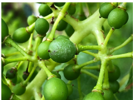
Echter Mehltau auf einer jungen Beere. Befall dieser Art ist nur durch aufmerksame Kontrollen zu finden.