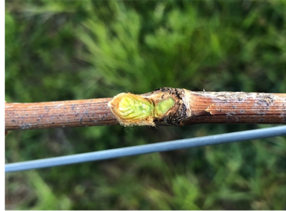
Knospenkontrolle: links geschädigte Knospe, rechts intakte.

Wo Frostruten vorhanden sind, diese noch nicht schneiden, einkürzen oder anbinden. Derzeit ist abwarten angesagt!